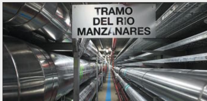
Sistema subterráneo de suministro de energía de Matadero Madrid. / A. G.

► 1996. Se produjo la clausura definitiva, trasladándose los servicios a Mercamadrid y proponiéndose usos