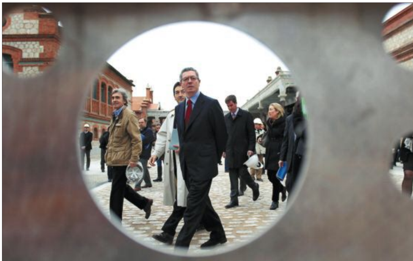
El alcalde Alberto Ruiz-Gallardón pasea por el patio de Matadero.