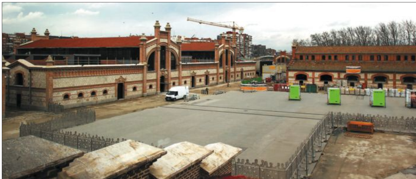
Vista general de la Plaza de Matadero, ya pavimentada, y de la nave 16 (a la izquierda), que será un gigantesco espacio de creación y exposición.

► 2006. Se inicia la construcción del anillo subterráneo de galerías, de un kilómetro de longitud (2006-2010), y en 2009 la central de instalaciones, cuyas